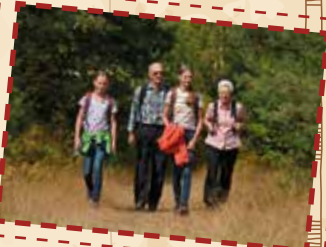
Haus Neuland Wanderweg